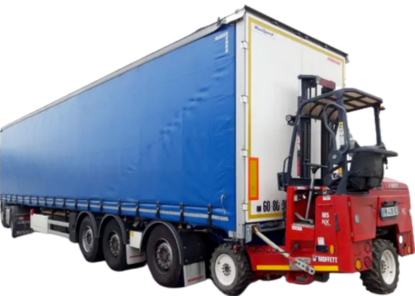
Camion poids lourd avec chariot élévateur embarqué (44 Tonnes ; L. 18 m ; l. 2,50 m ; H. 4,10 m)

Il n'est pas indispensable que le camion se gare devant le lieu de livraison. Il est possible qu'il se stationne au maximum à 300 m du lieu de livraison et de finaliser la livraison grâce au chariot élévateur embarqué.