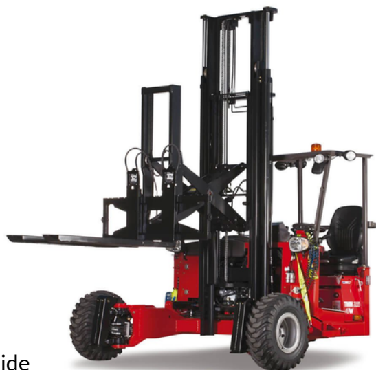
Chariot élévateur embarqué (3 Tonnes ; l. 2,50 m ; H. 3 m)